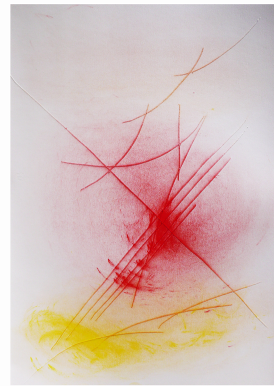
Senza titolo, incisioni, colori in polvere su carta - 2919

Il lavoro di Paolo Gubinelli (Matelica 1945), che vediamo ora in questa breve antologica, è tutto impostato sulla levità, ed è strano che sia meno ricordato di quanto potrebbe, in tempi come i nostri in cui si parla sempre di leggerezza e in cui tutto vuole essere soft e light. Ma una ragione c'è.