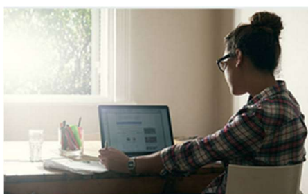
Dispositivo mobile posizionato di traverso/di spalle