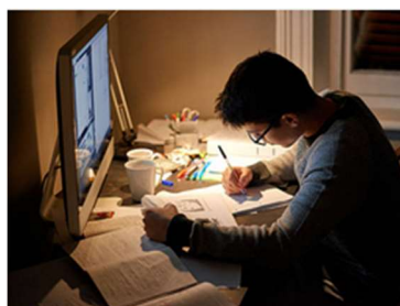
Stanza non illuminata e oggetti non autorizzati