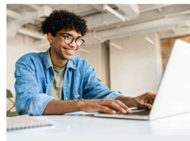
Dispositivo mobile posizionato troppo vicino e non laterale