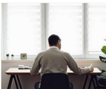
Dispositivo mobile posizionato alle spalle