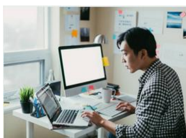
Utilizzo secondo monitor e oggetti non autorizzati