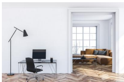
Stanza con apertura su altra stanza / stanza senza porta