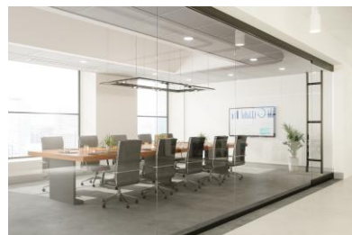
Stanza con pareti di vetro