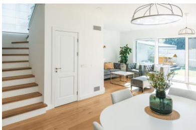
Stanza con più di un punto di accesso (porta, porta-finestra, scale interne senza porta)