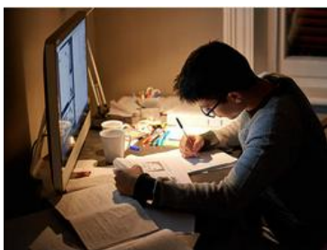
Stanza non illuminata e oggetti non autorizzati