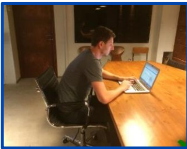
Inquadratura corretta che il dispositivo mobile deve restituire