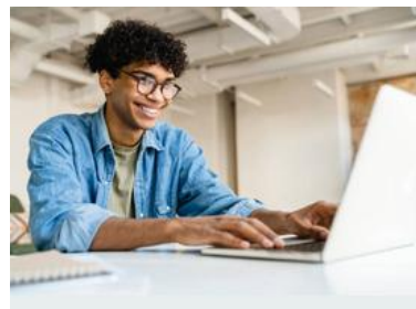
Dispositivo mobile posizionato troppo vicino e non laterale