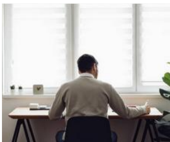
Dispositivo mobile posizionato alle spalle