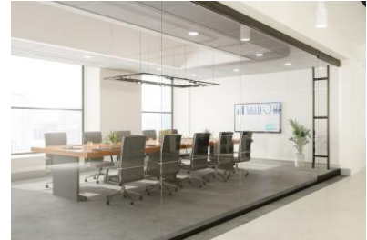
Stanza con pareti di vetro