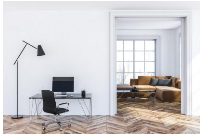
Stanza con apertura su altra stanza / stanza senza porta