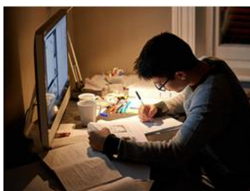
Stanza non illuminata e oggetti non autorizzati