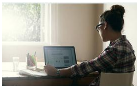
Dispositivo mobile posizionato di traverso/di spalle