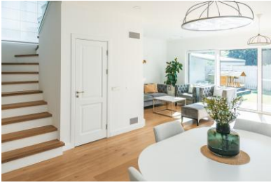
Stanza con più di un punto di accesso (porta, porta-finestra, scale interne senza porta)